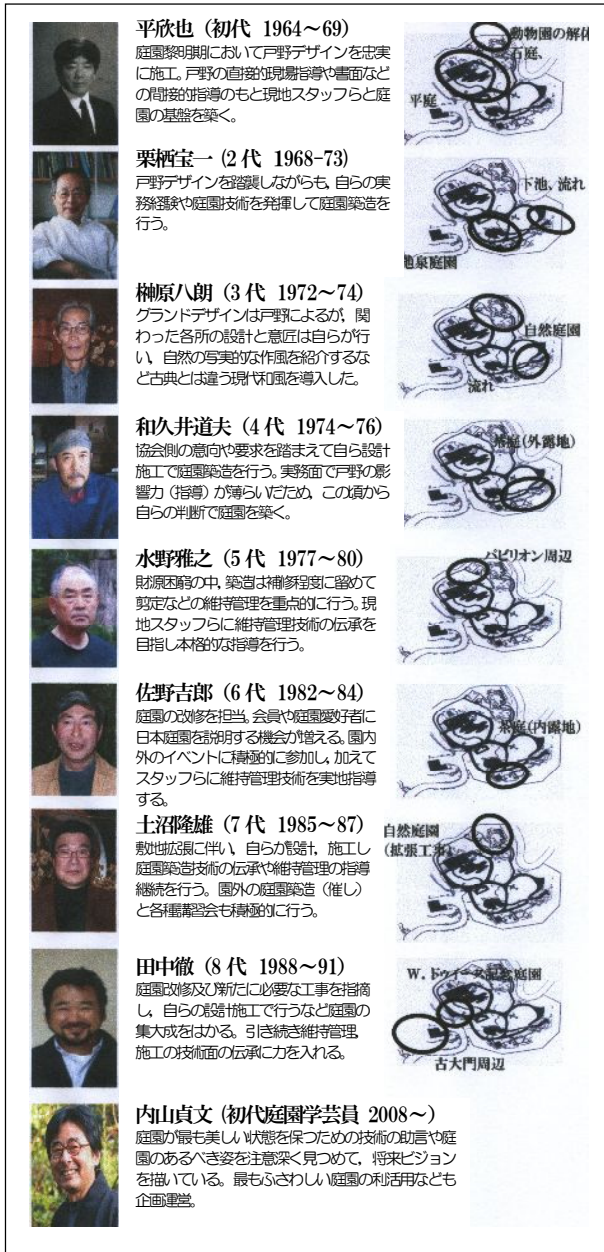
表一 ディレクターの役割と庭園活動における現在までの変容過程 (土沼隆雄作成原図 1999 1) に加筆)

者榊原と同様小形の弟子で、雑木の庭の空間構成やディテールをよく理解していた。在任期間、管理技術のトレーニングを行いながらも現地スタッフらと協働して自然庭園を違和感のないように拡張させ完成させた 2) 。